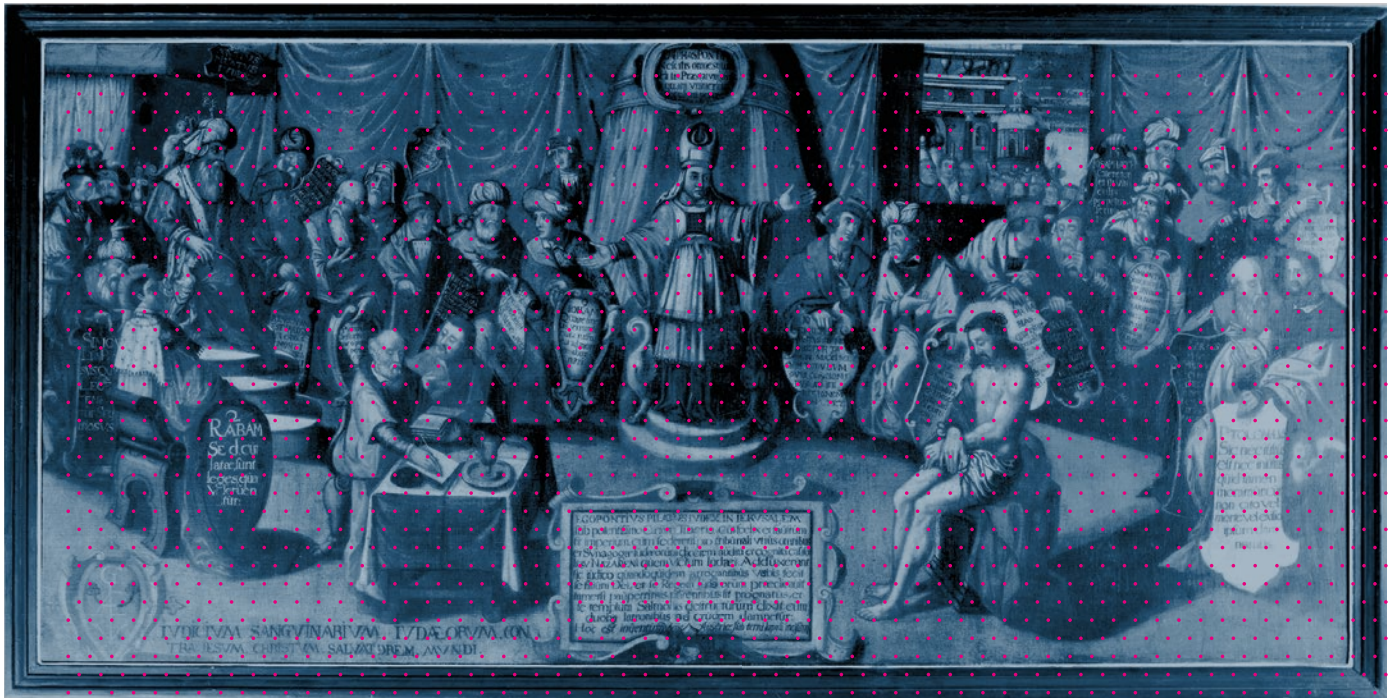
Abb. 4 – Erpel, St. Severin, Gemälde mit Darstellung Jesus vor dem Hohen Rat

In einigen Darstellungen des Leidens und Sterbens Christi finden sich in diesem Zusammenhang auch noch im späteren Verlauf der Passion Darstellungen von Hohepriestern, die im Hintergrund zu sehen sind und scheinbar das Geschehen überwachen. Damit wird die Verschwörungserzählung unterstützt, nach der Jüdinnen und Juden die Welt beherrschen würden. Die Idee der angeblichen jüdischen Weltverschwörung ist derzeit leider immer noch präsent und wurde gerade zur Corona-Pandemie oft rezipiert.