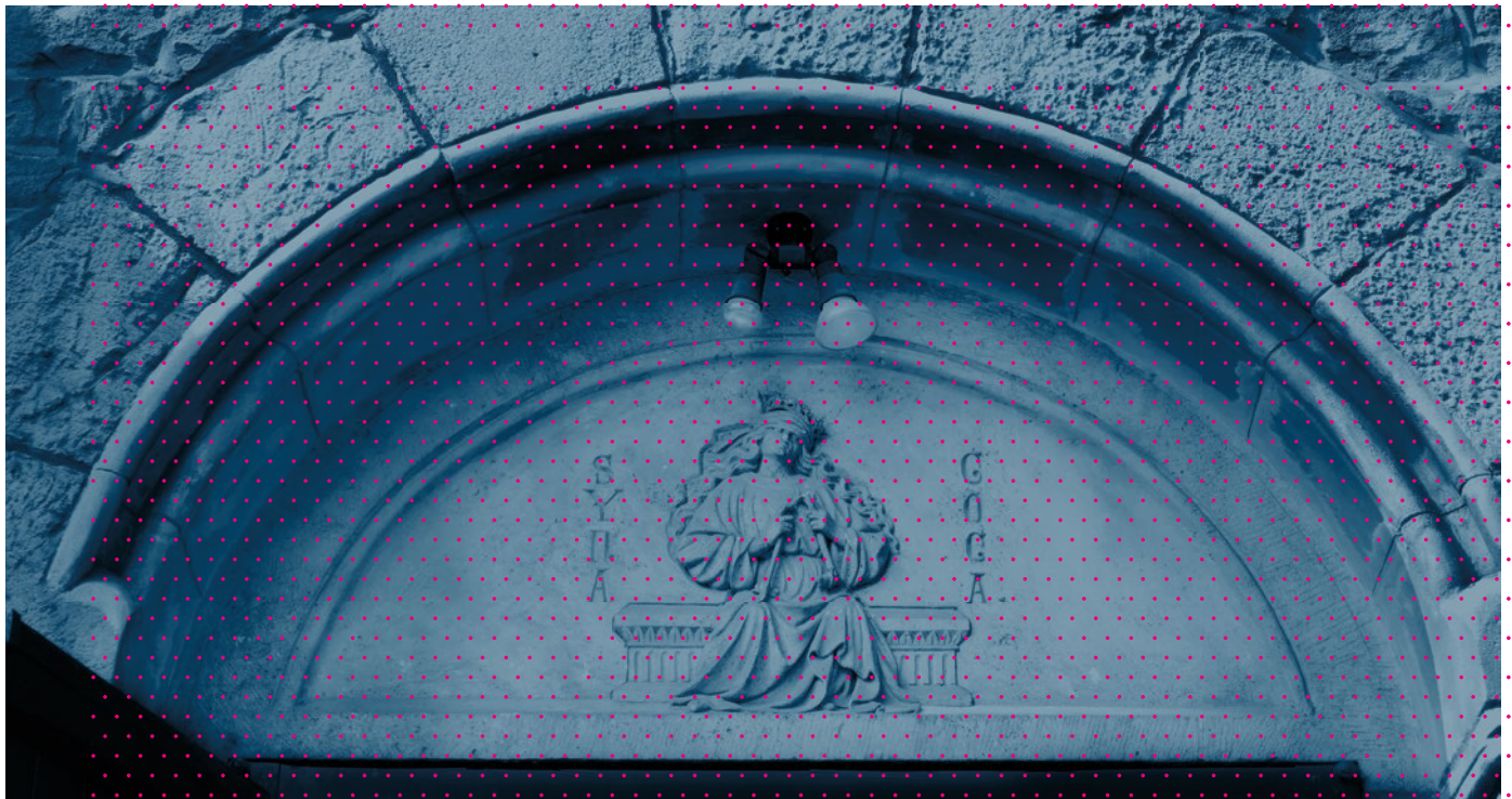
Abb. 1+2 - Aachen-Eilendorf, St. Severin, Portale mit Darstellung der Ecclesia und Synagoga