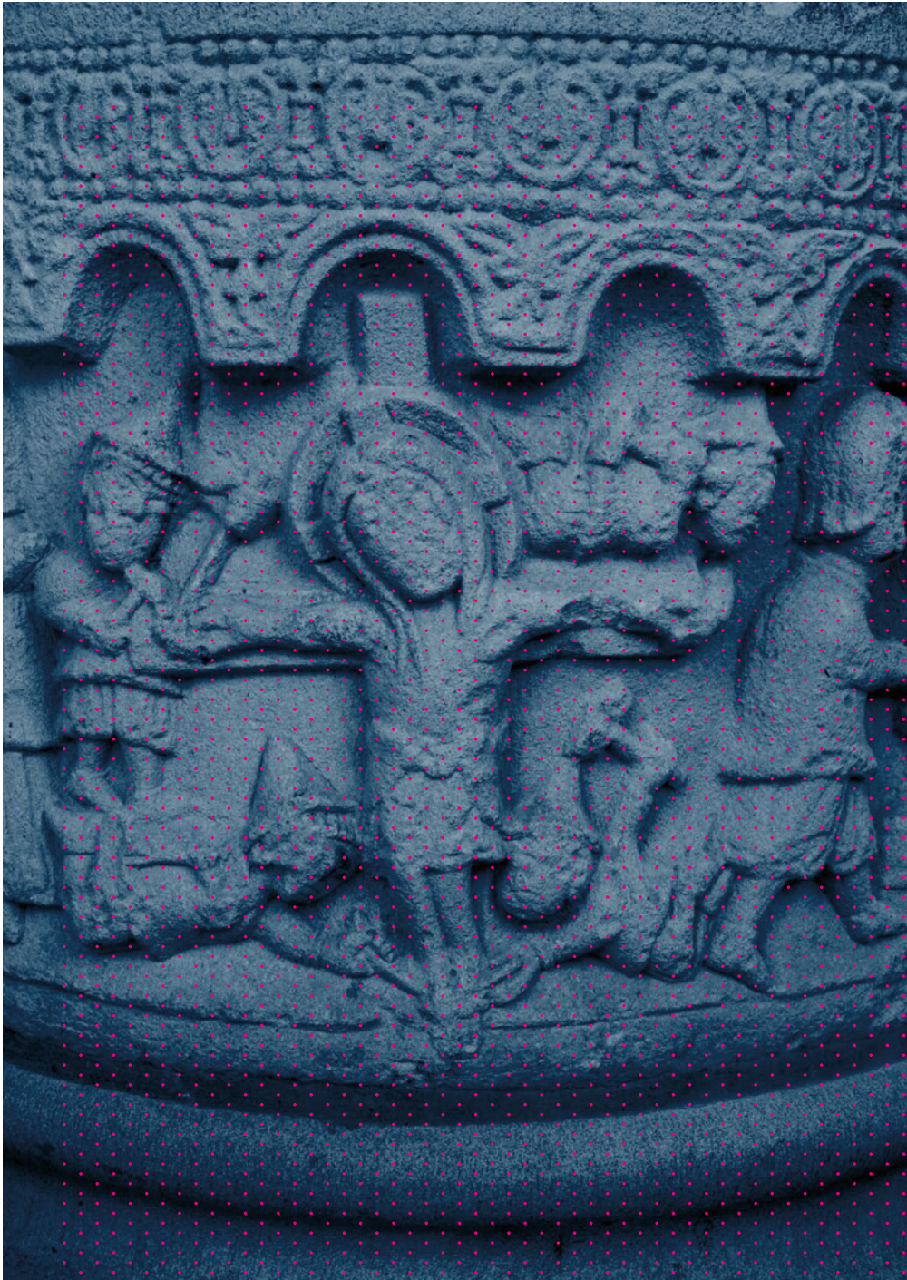
Abb. 5 – Dortmund-Aplerbeck, Georgskirche, Taufstein (Ende 12. Jh.) mit Darstellung der Kreuzigung Christi durch Juden